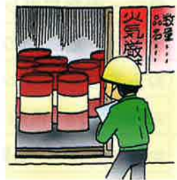
危険物の安全管理